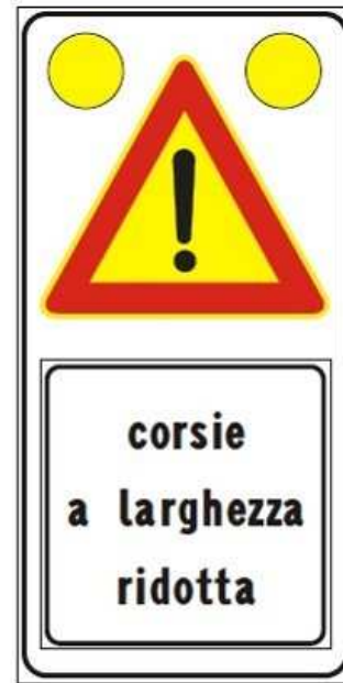
Figura Il 391c Art. 31