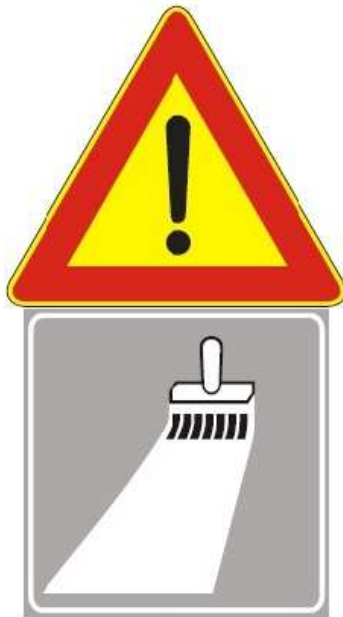
Figura Il 391 Art. 31